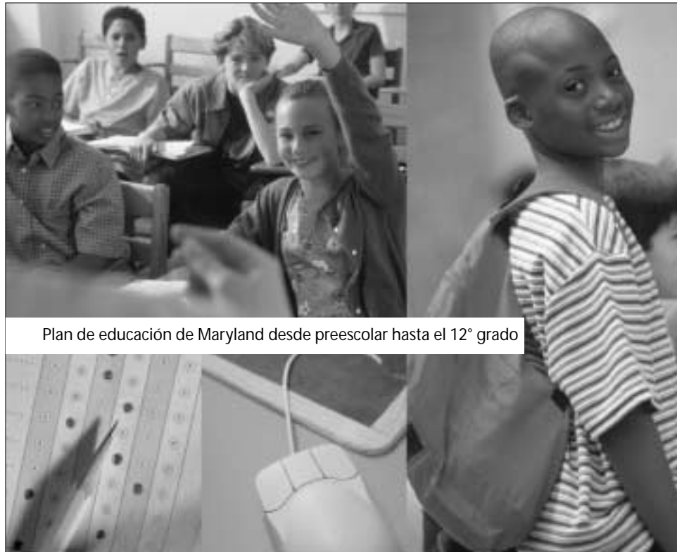
Plan de educación de Maryland desde preescolar hasta el 12° grado